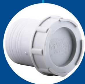
Clean out connector