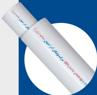
Soil and Waste Pipe