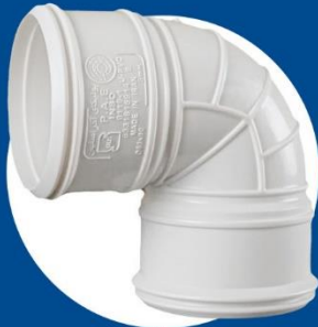
90-degree Elbow Coupler