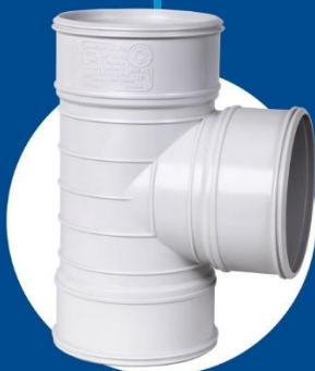
45-degree Tee Coupler