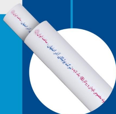
Rain Water Pipe