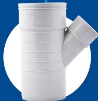
Reduce 45-degree Tee