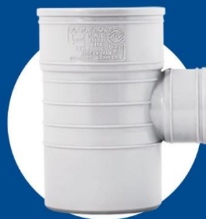
Reduce 90-degree Tee