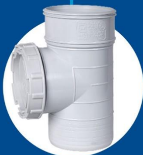
Clean out Tee