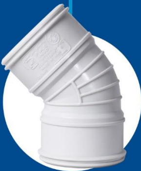
45-degree Elbow Coupler